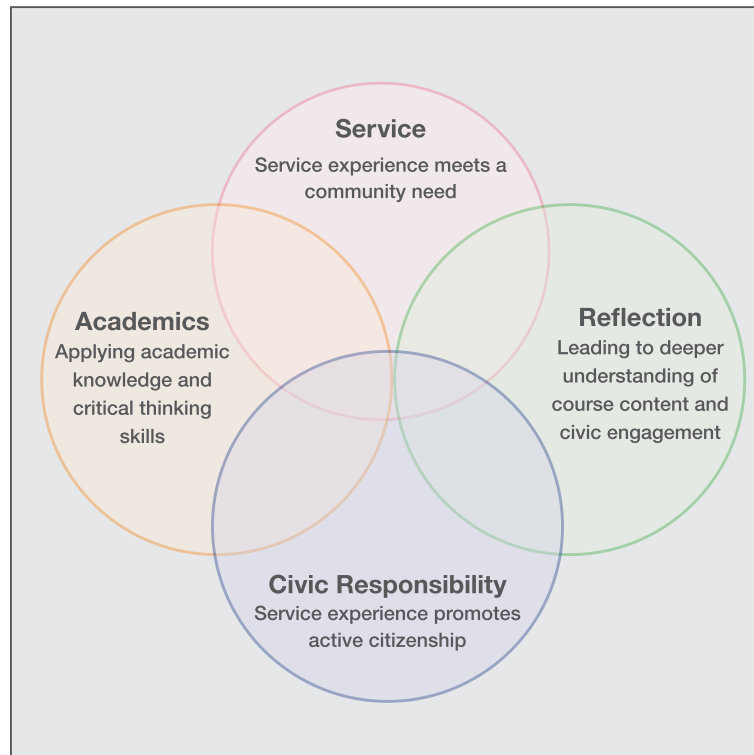
Fig. 1 - Rappresentazione del SL secondo la West Chester University.